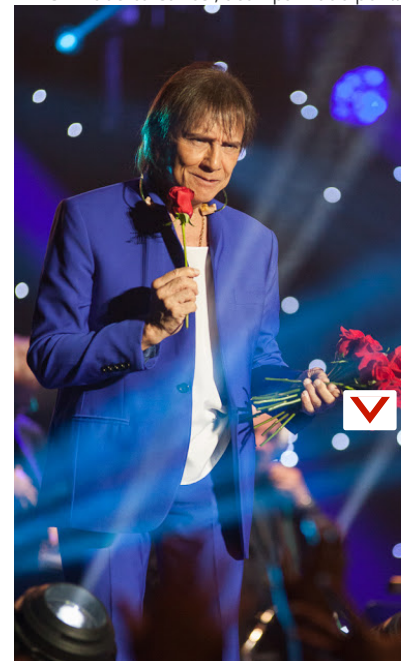
DIAS 04, 06 e 07 DE SETEMBRO DE 2019 PATROCÍNIO E PRÉ-VENDA: BANCO DO BRASIL Roberto Carlos, acompanhado por...

ROBERTO CARLOS, Orquestra e Coral no ESPAÇO D AMÉRICAS, em São Paulo